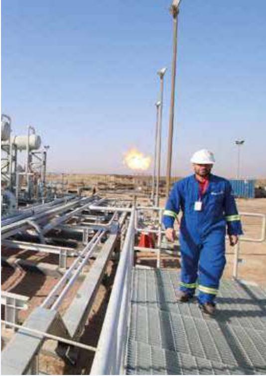
Fig 01.1 Oil Field – Iraq

يركز أويجاتيك ٢٠٢٥ على نشر التكنولوجيا الجديدة والحالية وأفضل الممارسات والأنشطة متعددة التخصصات المصممة للتأكيد على أهمية سلسلة القيمة وتعظيم قيمة الأصول. تعد المعرفة والقدرات ونقاط القوة لدى الدول المشاركة والعضوية العالمية للجمعيات الراعية، عبر مجموعة من التقنيات متعددة التخصصات، امرا أساسيا لنجاح المعرض، حيث تتطور التقنيات بوتيرة غير مسبوقة وتقدم ميزة كبيرة لشركات الطاقة. التي تدمجها في عملياتها لدفع تحول الأعمال، وتسريع عملية اتخاذ القرار ومعالجة ازالة الكربون من العمليات.